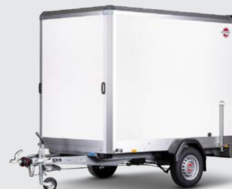
STPK 02 10-25-13.1 S18