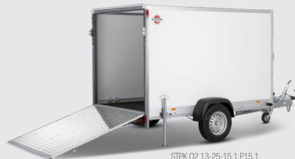
STPK 02 13-25-15.1.P15.1