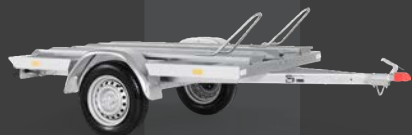
MT 750 BS2