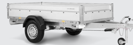
BASIC STL 750