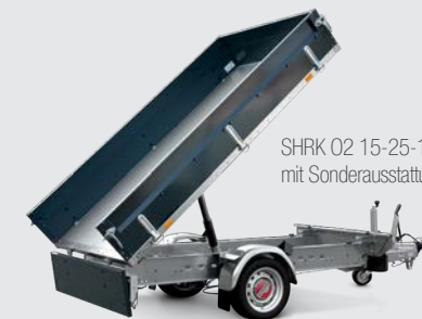
SHRK 02 15-25-15.1 mit Sonderausstattung