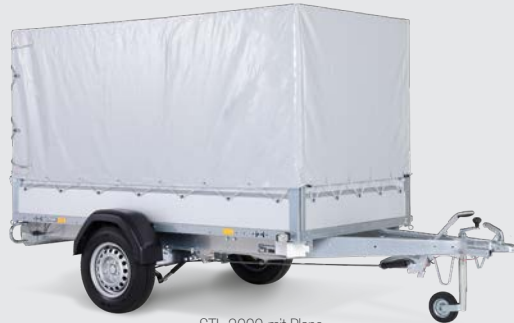
STL 2000 mit Plane