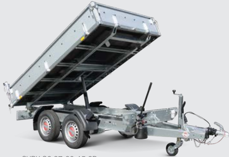
SHRK 02 27-30-15.2B