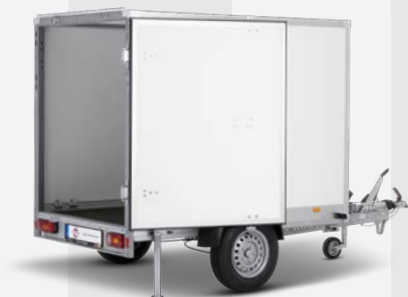
STPK 01 7.5-21-13.1.P15.1