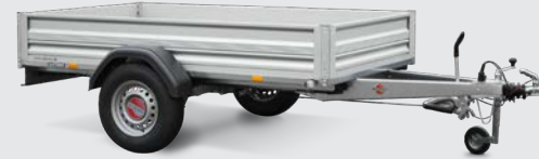
STL 1300 ALU