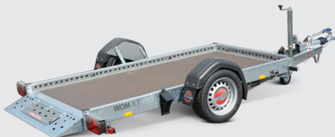
STS XT 02 10-25-13.1