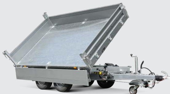
SHDK 02 35-30-18.2B