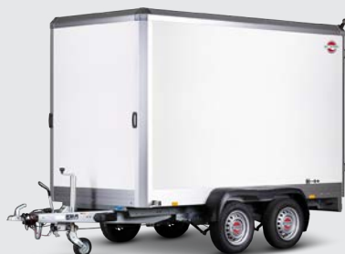
STPK 02 35-40-18.2 S18