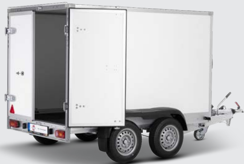
STPK 02 20-30-15.2.P18.2