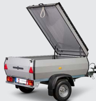
STEMA RETRO® Active