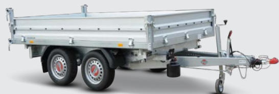
SHDK 02 27-30-18.2