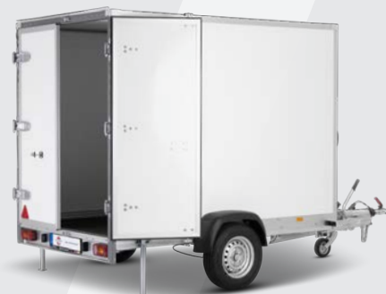
STPK 02 13-25-15.1.P15.2