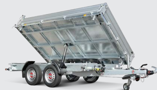
SHDK 02 35-36-20.2 Alu

SHDK 02 27-30-18.2 Handpumpe, Zink Beplankung