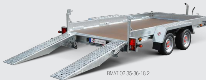
BMAT 02 35-36-18.2 mit Sonderausstattung

Extrem niedriger Auffahrwinkel mit einer Ladehöhe von ca. 460 mm